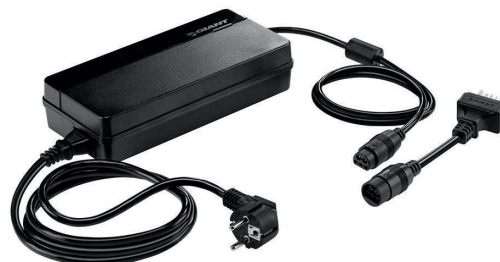
Caricabatterie in dotazione con l'ebike